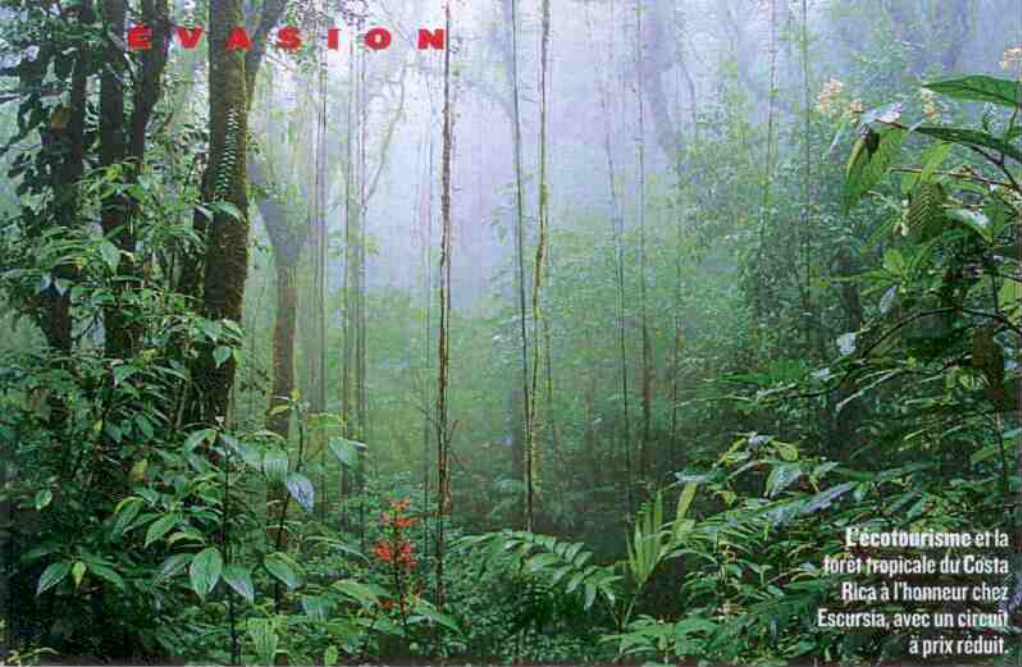
L'écotourisme et la forêt tropicale du Costa Rica à l'honneur chez Escursia, avec un circuit à prix réduit.